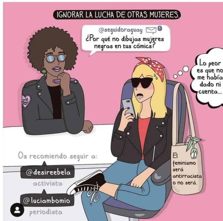
(Il·lustració: Moderna de Pueblo)

I tornant a la representació, ens hem d'adonar que, ara per ara, és una qüestió de privilegis i que molts cops no ens adonem de les absències, i aquest "no adonar-se" és un privilegi. Però podem fer un exercici de responsabilització per revertir aquesta dinàmica iii ; de fet, seguint la investigació de Tarabini, la justícia en educació passa per 4 principis: redistribució, reconeixement, cura i representació. En aquest dossier estem començant a apropar-nos al reconeixement i a la representació: hi ha presència i es dóna valor i respecte als sabers, habilitats i coneixements de diferents grups socials, tant a nivell organitzatiu com curricular, pedagògic i d'avaluació?