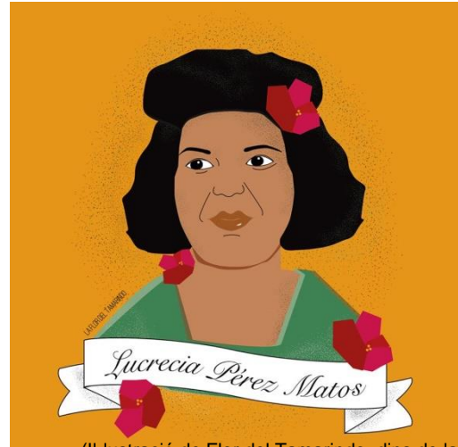
(Il·lustració de Flor del Tamarindo, dins de la iniciativa de referents de Negrxs Magazine. Lucrecia Pérez Matos va ser una dona dominicana, migrant i treballadora, assassinada al 1992 a Madrid pel fet de ser negra. El seu assassinat està enregistrat com el primer crim racista d'Espanya. Va ser un punt d'inflexió a la lluita antiracista de l'estat).